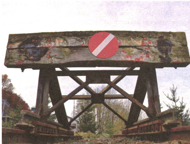
Paradigmenwechsel per Prellbock? Das herbeigewünschte Ende eines Paradigmas bedeutet nicht automatisch, dass tatsächlich etwas radikal Neues beginnt.

Zu diesem von mir damals erhofften Wandel kommt nun Angelika Hilbecks aktuelle Forderung nach