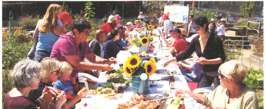
Slow Food Eat-In: gemeinschaftliches Essen ohne Multitasking als politischer Akt in Zeiten der Anonymität und Hyperaktivität?

Lemke nimmt kein Blatt vor den Mund, wenn er vom «Massaker des Hungers», vom «Dritten Weltkrieg» (Jean Ziegler) oder von der «Politik des kontrollierten Massensterbens des verwalteten Welthungers» schreibt. Die Banken habe man mit Unsummen gerettet, nicht aber die hungernden Menschen, empört sich der Autor. Lemke ist es wichtig, den Hun-