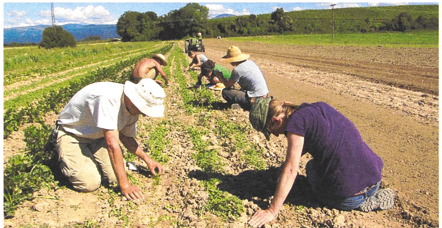
Grosses, gemeinschaftliches Rübli-Jäten von unstandardisierten Arbeitskräften.

Vielfalt ist der Gartenkooperative wichtig. Es werden ausschliesslich samenfeste Sorten angebaut. Die Fruchtfolge ist ausgeklügelt und langfristig. Lukas erklärt mir, dass sie die Flä-