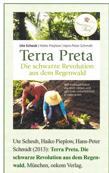
Ute Scheub, Haiko Pieplow, Hans-Peter Schmidt (2013): Terra Preta. Die schwarze Revolution aus dem Regenwald. München, oekom Verlag.

Weitere Informationen über Pflanzenkohle und ihre vielfältigen Nutzungsmöglichkeiten finden Sie im Ithaka Journal: www.ithaka-journal.net