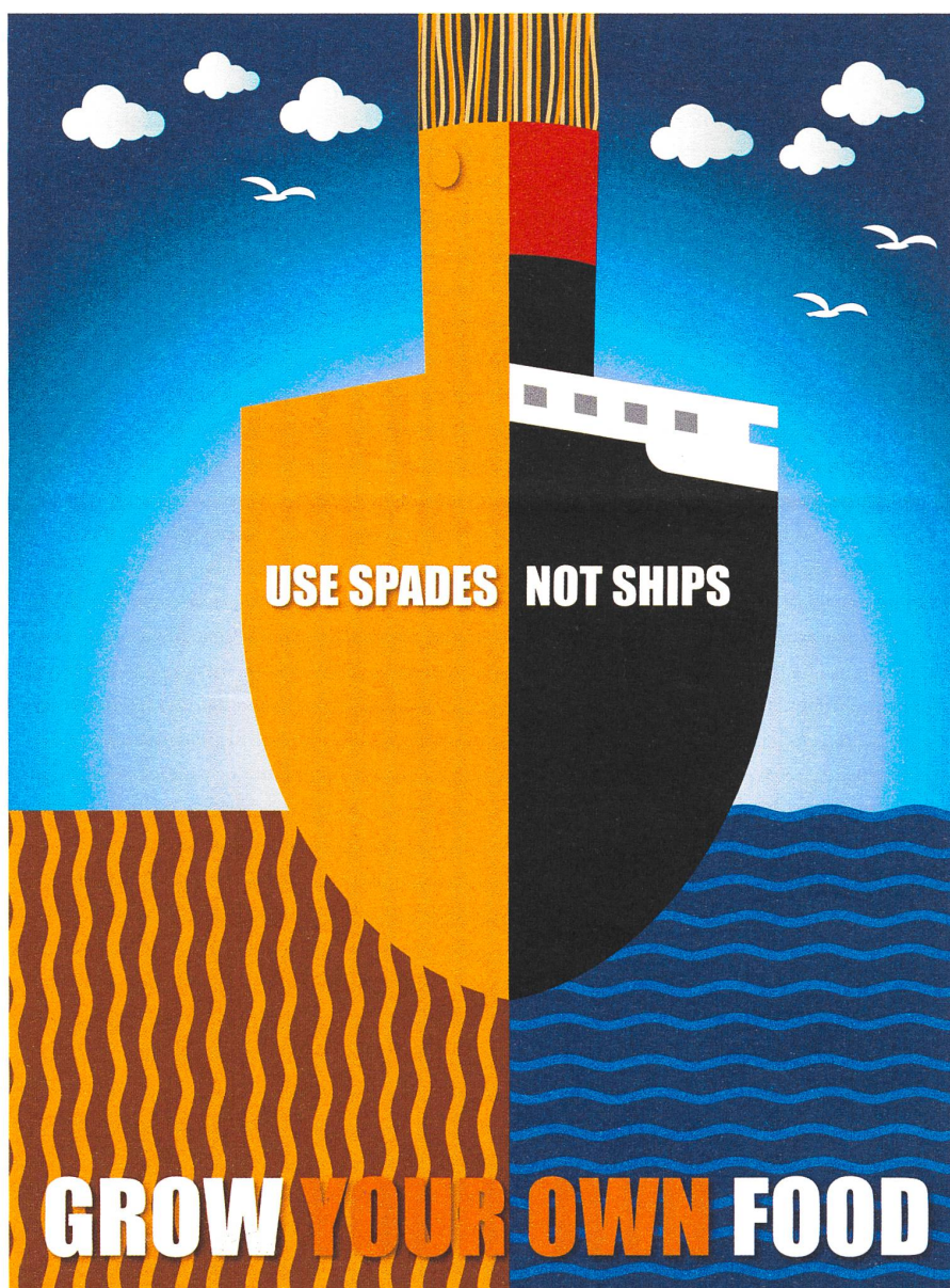
«Benutzt Spaten, nicht Schiffe. Baut eure eigenen Lebensmittel an.» Zeitgemäss umgestaltete und umgedeutete Illustration des Grafik-Designers Christian Guthier, die auf ein «War Office Poster» von Abram Games aus dem Jahr 1942 zurückgeht. Die neue Version hat nichts mit Kriegspropaganda, wohl aber mit unserer gefährlichen Abhängigkeit von Fremdversorgungssystemen zu tun.

Nein, die erste Initiative wird scheitern, wenn sie nicht die Reduktion der Verkehre anstelle einer technischen Umwandlung, die auf einer unerfüllbaren Versprechung beruht, ins Visier nimmt. Ein Moratorium für weitere Verkehrsanlagen, Strassen und Parkplätze zurückbauen, autofreie Innenstädte und Sonntage, höhere Preise für fossile Treibstoffe usw. – das wären viel billigere und wirksamere Konzepte, die auch ohne technischen Fortschritt funktionieren, der dann zumeist mehr negative Nebeneffekte hat, als er Probleme lösen kann. Die zweite Initiative erscheint mir nicht frei von nationalistischem Gedankengut zu sein; deshalb ist sie unvereinbar mit meinen Vorstellungen von Demokratie, Solidarität und Freiheit. Die dritte Initiative könnte nur dann sinnvoll sein, wenn sie ihren Füllhorncharakter dadurch verliert, dass sie in ein umfassendes Massnahmenpaket eingebettet ist: Arbeitszeitverkürzung und