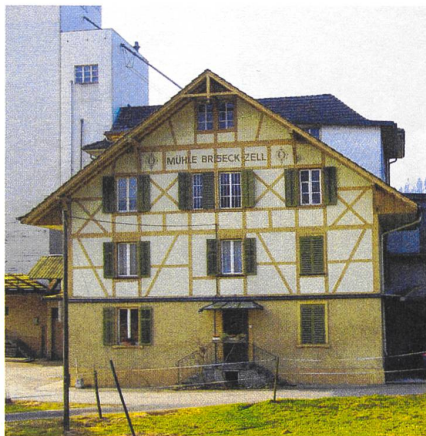
Die Ölmühle Briseck bei Zell.