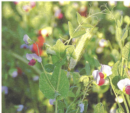
Symbiontisches Beziehungsnetzwerk: Wintererbse und Winterroggen im Mischkulturanbau.

Doch es geht noch weiter. Pflanzen scheinen auch aus Erfahrung lernen zu können. Köchlin: « Pflanzen erinnern sich an vergangene Ereignisse – und vererben diese Erinnerungen sogar an ihren Nachwuchs. So können Tomaten, die einmal von Raupen angefressen wurden, sich beim zweiten Mal viel besser wehren. Und auch deren Nachkommen wehren sich besser gegen Frassfeinde – sie haben die Erinnerungen an den Raupenangriff von ihren Eltern geerbt.» Dieses Phänomen lässt sich vermutlich über die Epigenetik erklären. Gewisse Gene werden aufgrund veränderter Umweltbedingungen an- oder ausgeschaltet. Köchlin folgerte: «Diese Beispiele zeigen, dass Pflanzen keine passiven Objekte sind, sondern Subjekte in den Beziehungsnetzen ihrer Umwelt.»