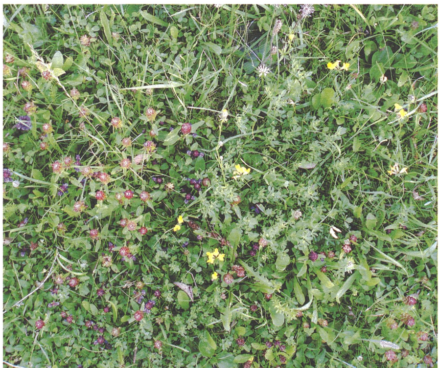
Je grösser die oberirdische Vielfalt, desto vernetzter und widerstandsfähiger ist auch das Leben unter der Erde.