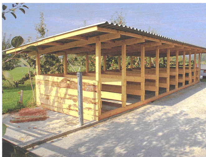
Veloständer-Holzboxen für die Ausmasttiere.