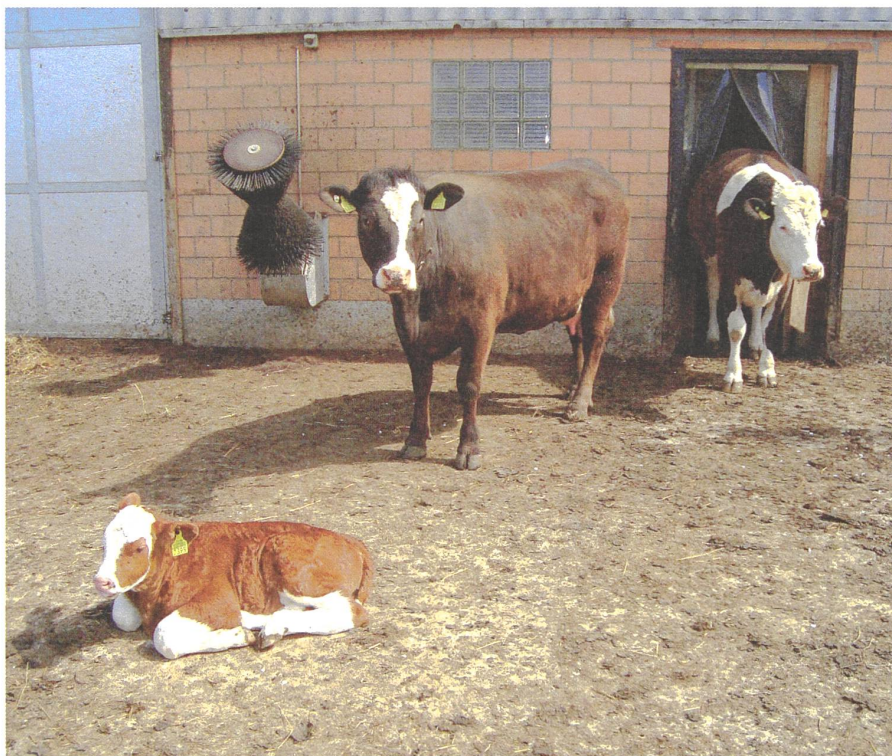
Mutterkühe (Simmental x Angus) mit Kalb (Simmental) im Auslauf.