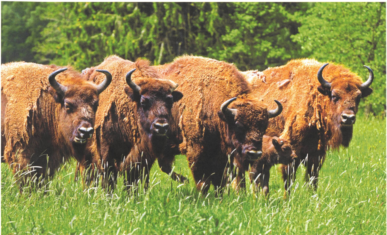
Wisente sorgen für Grasland in Europa.

AI: Ich glaube, die Antwort ist simpel: Das gigantische Grasland-Potenzial wird schlicht nicht erkannt. Wenn wir nach den Gründen für diese Nicht-Wahrnehmung fragen, wird es kompliziert. Sie sind komplex und haben eine lange Geschichte.