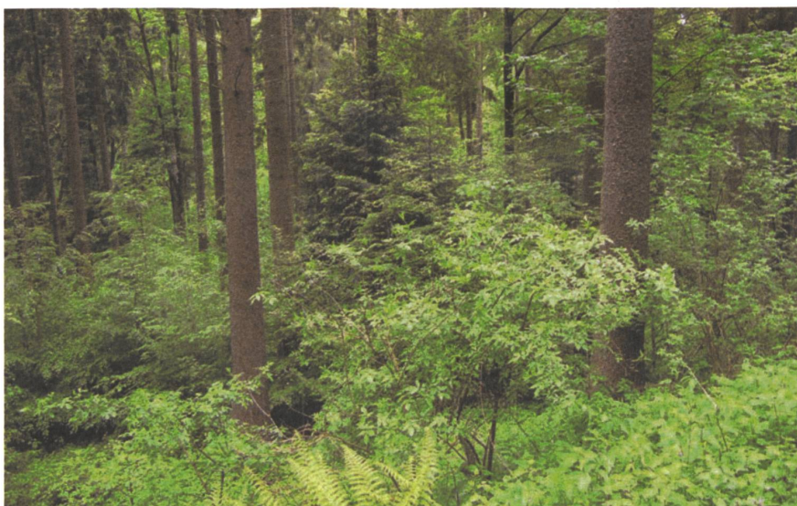
«... für 10% des Schweizer Waldes Dauerwald oder Plenterung vorgesehen».

Im Rahmen des Landesforstinventars (LFI) werden die Förster nach der Art des nächsten Eingriffs befragt. Die Erhebungen des LFI4 (2009-2013) zeigen, dass für 10% des