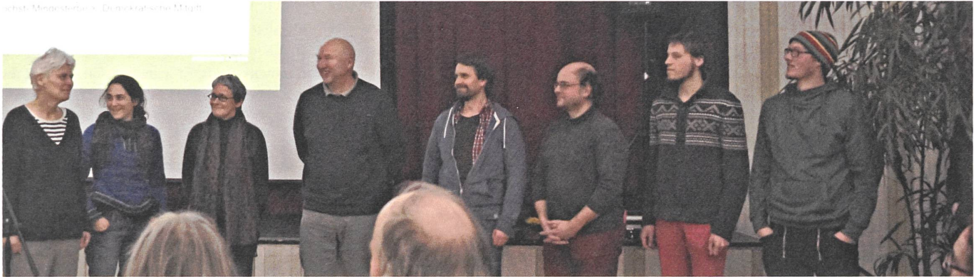
Teilnehmer der Demeter-Bodensee-Zusammenkunft bei einem Spiel auf der Bühne