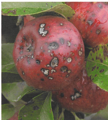
Bio-Apfel <Topaz> - leider nicht krankheitsresistent wie von den Züchtern versprochen.

Wenn wir aber glücklich sind, einen Einzelfall zu erkennen: ja, dieses Gen dieses Wildapfels schützt gegen Schorf!, und ein Züchter also dieses Gen in eine anfällige Kultursorte einbaut, dann haben wir das Problem, lehrt bittere Erfahrung, damit nicht gelöst: So eine einzelne Waffe, die in einen anderen Organismus