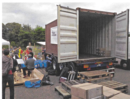
Jetzt ist er leer