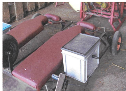
Das elektrisch angetriebene Jätvelo ist leicht gebaut.

Das beste Mittel, um dem Humusabbau entgegenzuwirken, sind Dauerwiesen und Weiden. Seit Grossvaters Zeiten werden auf dem Hof schon Tiere gehalten und auch heute wird das meiste Land als Weide- und Futterfläche für die Milchkühe genutzt.