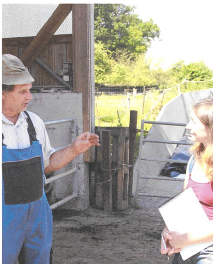
Der Altbauer erklärt uns seinen Hof.