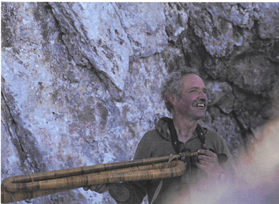
... den Ohren und den anderen Sinnen!

Und wenn du nicht weisst, wie die Geschichte vom Schellenursli möglicherweise weitergegangen ist, dann hast du vielleicht jetzt eine Ahnung davon.