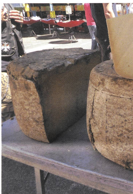
Dieser Rohmilchkäse auf einem südfranzösischen Markt: ein Stück Kultur.

amerikanische Philosoph Michael Sandel in seinen Büchern sehr erhellend. 1 (Nebenbei: Unterschiedliche Vorstellungen über die Monetarisierbarkeit von Dingen sind vermutlich der stärkste Grund, weshalb zwischen industrieller und nachhaltiger Landwirtschaft eine Trennlinie verläuft. Geld ist eine Art künstlicher Rohstoff und mächtiger als alle anderen , aber nicht allen Menschen gleichermaßen verfügbar. Der Volksmund bezeichnet ihn mit Kohle, Kies, Pulver, Chlütter, und wer reich war, hatte Geld wie Heu.)