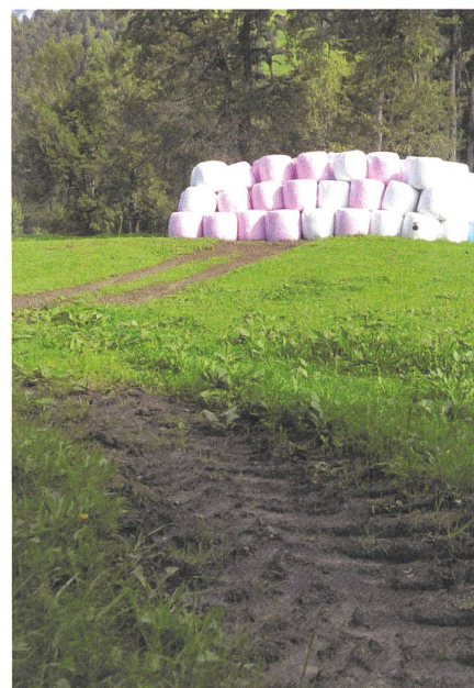
Siloballen im Berggebiet: Die rohe Praxis gefällt weder Boden noch Kleintier.

Was wäre, wenn wir einen anderen Ausdruck für Rohstoff fänden? Oder, worauf ich hinauswill, ohne die Komplexität dieses populären Wortes ganz erfassen und ausbreiten zu können: Ich selber will nicht Rohstoff sein und ich will deshalb auch nicht, dass ein Tier es ist. Ein Tier hat Würde. Auch ein Baum ist mehr als Holz und die « living salad »-Packungen, die seit jüngst zwecks Frischhaltung mit ihren Wurzelballen im Gemüsegestell der Grossverteiler liegen, sind ein Skandal. Der Boden, auf dem die Landwirtschaft wie die Landschaft fussen, ist mehr als Dreck. Erde ist nicht roh. Sie gehört zum Wunder des Planeten Erde: nicht fassbare Unwahrscheinlichkeit, dass Leben überhaupt möglich wurde. Den Tieren stehen wir näher als dem Salat und den Rüben. Granit und Kupfer lassen uns kalt. Höchstens wenn eine marode Fabrik in Asien abbrennt oder ein Rückhaltebecken mit giftigen Stoffen in Südamerika überfließt, weil das «Kochen» der rohen Stoffe zu leichtfertig betrieben wird, erreicht uns ein Moment der Unsicherheit oder des Bedauerns. Dann ruft wieder die Pflicht des hier gelebten kultivierten Alltags.