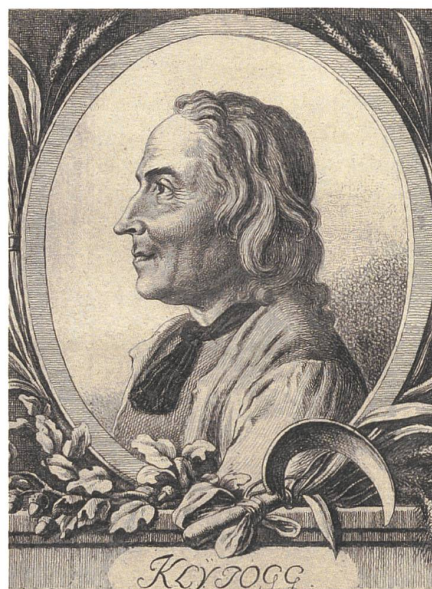
Verehrungsbild des Kleinjogg von J.R.

Dieser höchst «schaffige» Bauer erschien als perfekte Personifikation zwinglianischer Arbeitsethik. Müssiggang war ihm ein Gräuel. Auf die Frage, warum er nicht das Bienenhaus erneuere, meinte er, die Bienen würden die Leute von der Arbeit abhalten, weil niemand einfach an einem Bienenhaus vorbeigehe, sondern alle stehen bleiben, den Bienen zuschauen, zu schwatzen anfangen und