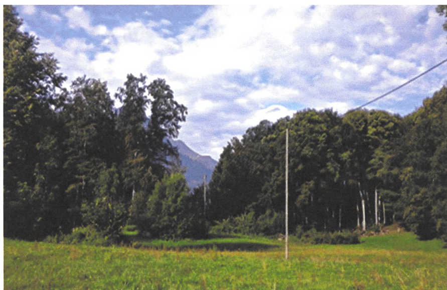
Dieses Stück Land soll es werden.