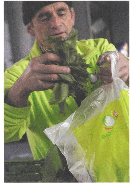
Marktfahrer in Brugg.

Das anfangs unkonventionelle Thema entpuppte sich aber auch als ideales Kommunikationsprojekt für tiefergehende Fragen. Vor unserer Haustüre steht Pownahrung für Raupen und für uns, und wir nennen es Unkraut. Die Brennnessel ist Wildgemüse und zugleich uralte Kulturpflanze. Wir