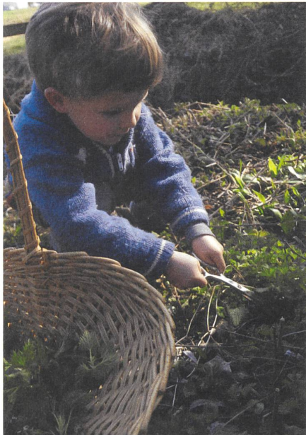
Das hat auch etwas mit Naturbeziehung zu tun.

Die Brennnessel hat ein gespaltenes Ansehen, das in unserer Gesellschaft stark verwurzelt ist. Im germanischen Volksglauben wurde die wehrhafte Brennnessel mit dem Kriegsgott Donar/Thor und in christlicher Zeit mit dem Teufel assoziiert und stand für die ungebändigte Natur. Die Nähe der Brennnessel zum Bösen verlieh ihr aber auch dämonenabwehrende Eigenschaften.