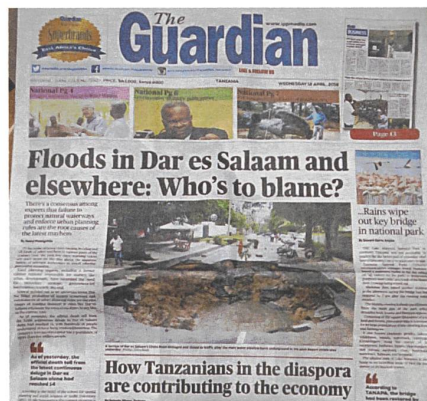
Titelseite einer tansanischen Zeitung, 18. April.

Fortschrittsgläubigen genügte jedoch politische schwarz-weiß Bilder vollauf. In den gerundeten schwarzen Bäuchen erblickte die weiße Welt das Symbol des Hungers, den sie überwunden hatte. Weil in Biafra sehr viele Kinder starben, wurde