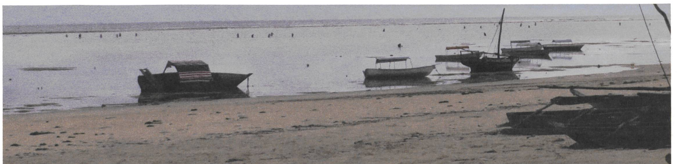
Strand im westlichen Sansibar, Tansania, 10 km vor Bill Gates' Privatinsel. Die kleinen Figuren im Hintergrund sind Frauen, die Seetang sammeln. Oben: Reisfelder im Landesinneren.

Die Geschichte des Hungers als menschgeschaffenes Elend und zugleich als Metapher für verdrängte politische und wirtschaftliche Realitäten wäre vollständig noch zu schreiben. Drei frühe Bücher dazu möchte ich mit je einem Satz erwähnen. 1975 gab der North American Congress on Latin America eine Studie heraus: Weizen als Waffe. Darin steht zum Beispiel der