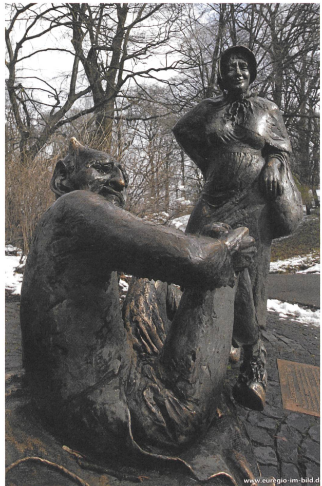
Diese Frau lässt sich von der ‹neoliberalen› Verführung nicht blenden.

Ein eben erschienener Sammelband unter dem Titel ‹Zwang zur Freiheit› zeigt mit historischen Analysen, wie der Neoliberalismus in der Schweiz Fuss fasste. 2 Das gilt nicht nur für Firmen und Konzerne, die mit Restrukturierungen zugunsten der Aktionäre und des Managements eine Delegation von Verantwortung nach unten an die Mitarbeitenden bewirkten und gleichzeitig deren ‹Flexibilität›, also Ersetzbarkeit, einforderten. Auch politische Parteien richteten sich heute weniger mit einem gegenüber anderen