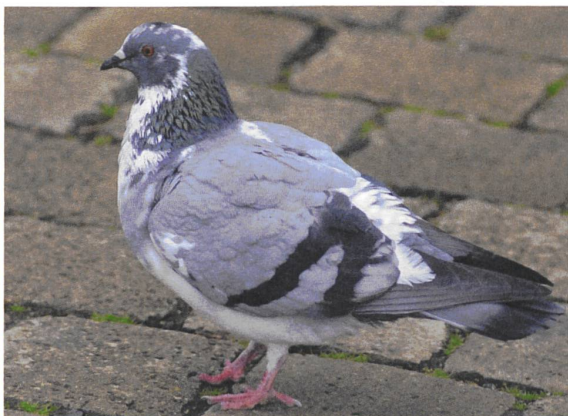
Ringeltaube und Stadttaube. Die unregelmässige Scheckung rechts als Begleiterscheinung einer verminderten ökologischen Beständigkeit im urbanen Milieu interpretiert.