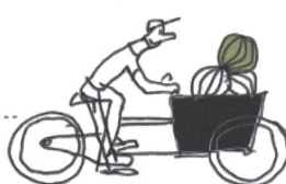
Kurzdarstellung des Handelsweges auf der Homepage.