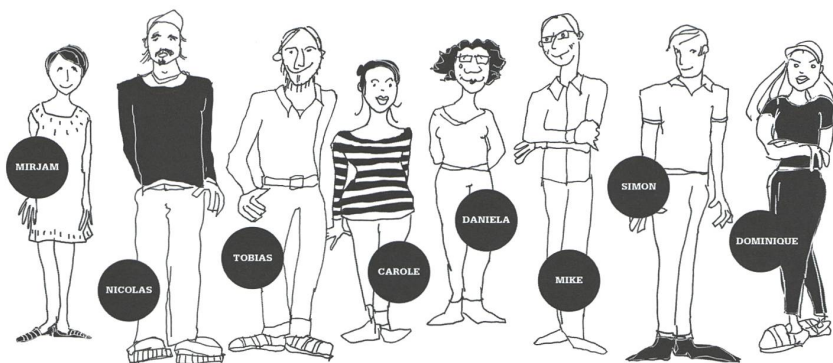
Selbstdarstellung auf www.crowdcontainer.ch/ueber-uns .

Peru oder seit 2018 auch in der Schweiz – alle Kooperativen klagen das gleiche Lied: fehlende Wertschätzung ihrer qualitativ hochstehenden Produkte, marginale eigenen Absatzmöglichkeiten und die zunehmende Herausforderung durch die sich verändernden klimatischen Bedingungen. Wenn dabei äussere Faktoren, zum Beispiel fehlende Niederschläge, Kälte oder heftige Unwetter wie in Kerala letztes Jahr, die Balance der Kreisläufe stören, trifft es die Produzent(inn)en besonders hart.