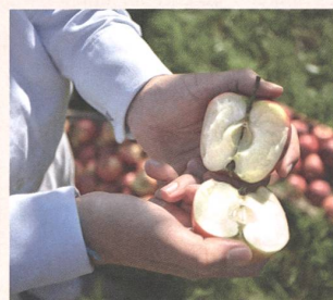
Hochwertige, geprüfte Rohstoffe