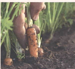
Bio-Anbau seit über 60 Jahren