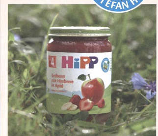
Klimaneutrale Produktion der Gläschen