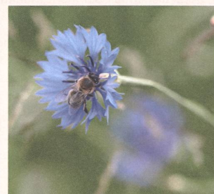
Intakte Natur durch biologische Vielfalt