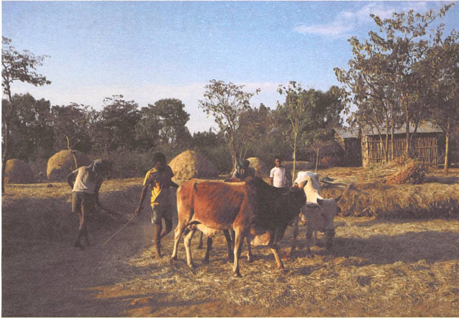
Mit Ochs wird Hirse gedroschen.