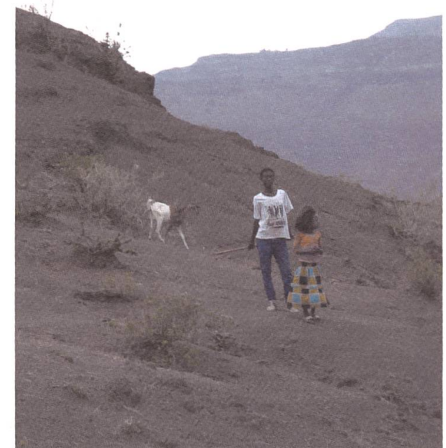
Kinder hirtet die Ziegen.