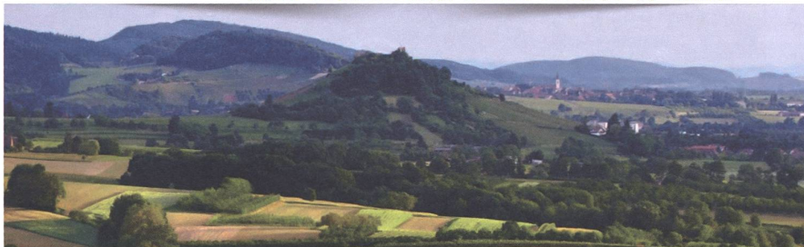
Es ist ein Ziel auch der Regionalwert-AG, Subsistenzwirtschaft auf regionaler Ebene zu gestalten.

Willkommen Die Regionalwert AG Leistungen Partnerbetriebe Forschungsprojekte Blog Veranstaltungen