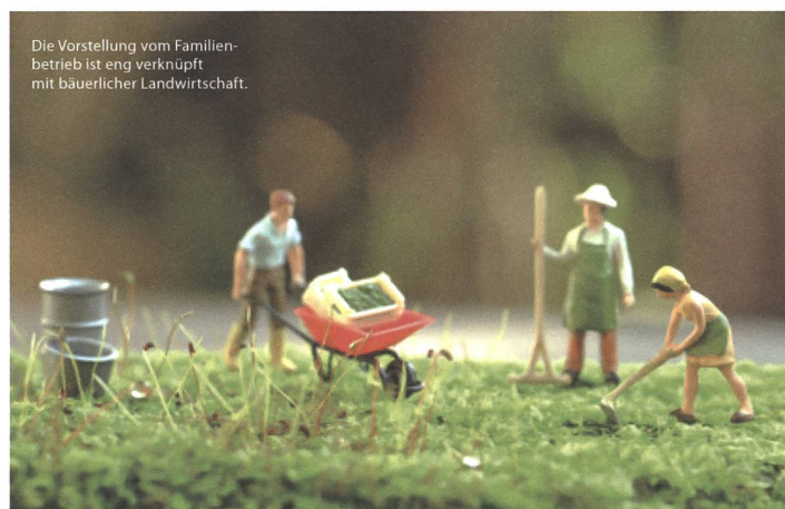
Die Vorstellung vom Familienbetrieb ist eng verknüpft mit bäuerlicher Landwirtschaft. Ein unscharfes Bild, Projektionsfläche für Wünsche und Vorurteile. Die Redaktion von Ökologie & Landbau illustrierte so einen Artikel zu Bäuerlichkeit.

Je ausgeprägter die Selbstversorgung war, desto vielfältiger waren die Betriebe. Landwirtschaftliche Produkte wurden am Hof verarbeitet, zubereitet und gegessen. Holz und Faserpflanzen für die Versorgung mit Baumaterial, Wärmeenergie und selbstgewebten Stoffen wurden in hohem Masse selbst angebaut und verarbeitet. In den Jahreszeiten, wenn weniger landwirtschaftliche Tätigkeiten anstanden, spielte das Handwerk eine grosse Rolle. Ausser Kleidung wurden Werkzeuge und Möbel herge-