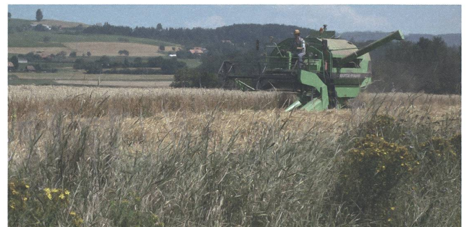
Der junggebliebene Mähdrescher.