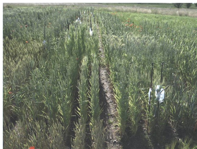
Auch im Zuchtgarten der gzpk in Feldbach ist ein üppiges, farben- und formenfrohes Klimafenster gewachsen. Hier Aufnahmen aus den Monaten April, Mai, Juni und Juli.