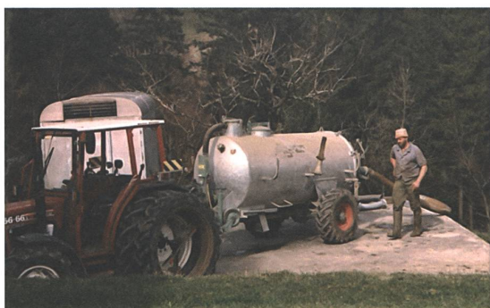
Bauer sein war mein Lebenstraum.

Ich möchte da nur eines erwähnen: die Siloballentechnik . Ich erinnere mich noch gut, als die ersten «Strausseneier» aufkamen. Damals dachte wohl niemand, wie diese Technik bahnbrechend sein wird. Während langer Zeit gehörte der Ladewagen zur Standardausrüstung. Jetzt gibt es immer mehr Betriebe ohne einen solchen. Die Ballentechnik hat vieles verändert. Auf meinem Betrieb war der Engpass in der Heuernte stets das Abladen und Versorgen auf dem Stock. Die zu mähende Fläche musste sich nach der Kapazität des Abladens richten. Dies ist mit den Ballen nun anders: das Versorgen entfällt oder kann irgendwann später nachgeholt werden. Damit können Riesflächen auf einmal gemäht werden. Auch die Distanz vom Feld zur Scheune spielt keine Rolle mehr; mit der Folge, dass der Druck auf freies Pachtland weiter zugenommen hat, auch weiter entfernte Bauern bieten mit. Die mit der Ballentechnik mögliche grossflächige Nutzung und das sofortige Einpacken beschleunigt das Aussterben der Biodiversität in den Wiesen wesentlich mit. Während früher 2-3 Sonnentage ohne Regen nötig waren für die Futterkonservierung,