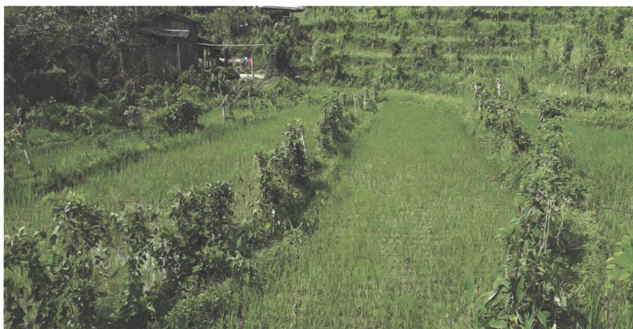
Agrarökologie auf den Philippinen, AGROECO. Selbstversorgung hilft auch, sich während wirtschaftlicher Krisen zu ernähren.

sam eine realistische Perspektive zu entwickeln und die Verantwortung würde miteinander getragen und nicht nur einer Personengruppe (Bauern) aufgebürdet. Es gibt keine Alternative, als durch einen gegenseitiges Verständnis schaffenden Dialog die Prinzipien agrarökologischer Landwirtschaft Schritt für Schritt sowohl der Bevölkerung als auch der Politik verständlich zu machen. Wer sollte sich dagegen aussprechen, den Hunger weltweit endlich zu besiegen und eine sichere Zukunftsperspektive für kommende Generationen sicherzustellen, indem der Natur wirklich Sorge getragen wird? Wie im vorgestellten Buch unterstrichen wird, lässt sich die Transformation des Ernährungssystems in einem Land zu einer natur- und menschengerechten Art der Produktion nur erwirken, wenn die Bevölkerung sich mit Überzeugung für diesen Weg entscheidet . Sobald Menschen verstehen und sich dessen versichern können, dass es sich bei der Agrarökologie um ein zutiefst ethisches Konzept der Landwirtschaft handelt, wird es für die meisten nicht viel Überzeugungskunst brauchen, gemeinsam die erforderlichen Schritte einzuleiten. Der Geist der Agrarökologie, der die gleichwertige Kooperation zwischen dem traditionellen, lokalen Wissen und der Wissenschaft sowie die Pflege demokratischer Beziehungen zur Grundlage hat und auf ein Resilienz förderndes Verhältnis zwischen Mensch und Natur angelegt ist, erinnert stark an Albert Schweitzers zeitlose Ethik der « Ehrfurcht vor dem Leben ».