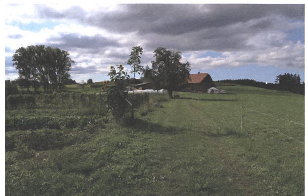
NaturGut Katzhof in der Schweiz.

langjähriger weltweiter Forschung nachweisen können, dass Menschen sehr gut in der Lage sind, ohne Profitorientierung miteinander Gemeingüter zu verwalten. Sie widerlegte die damals in den Wirtschaftswissenschaften populäre, reduktionistische Auffassung, wonach alle Menschen als Homo oeconomicus zu verstehen seien; diese Sichtweise lieferte die bequeme Rechtfertigung für alle Formen sozialer Ungleichheit und von Elend, als ob Armut und Hunger Folgen natürlicher bzw. schicksalhafter Selektionsvorgänge wären. Die UNO erklärte in Anlehnung an Ostroms sozialetischen Ansatz in der Ökonomie das Jahr 2012 zum Internationalen Jahr der Genossenschaften.