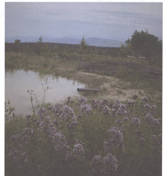
Impressionen vom Hof