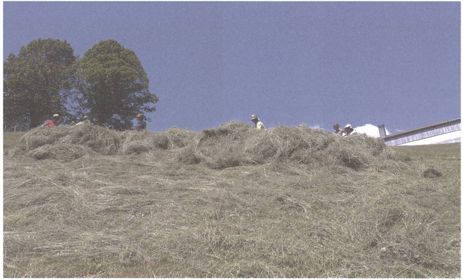
Heuen am Port.

Ab 2022 wird nun unser Angebot von hoch tragfähigen Betreuungsplätzen trotz immer noch vielen Anfragen ein Ende nehmen.