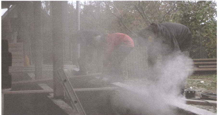
Bauen am Pschüttloch.

Zimmermann abgeschlossen. Da wir einen grossen Teil unseres Lebens in Häusern verbringen, unsere Bauten das Zusammenleben, unseren Energieverbrauch und unsere Gesundheit stark beeinflussen und ich selber gerne baue, bin ich immer wieder am Planen und Ausführen. Unsere Häuser sollen langlebig und sehr gemütlich sein, mit Materialien aus der Umgebung gebaut werden und nur wenig Fremdenergie verbrauchen. Die Häuser sind, wo möglich, mit Holz und Lehm, wo nötig und sinnvoll mit Beton, Glas usw. gebaut. Wir heizen die Räume und das Warmwasser mit Holz und thermischer Sonnenenergie und kochen hauptsächlich mit Holz. Wir begeistern uns für einfach nachvollziehbare und hocheffiziente Technik. Wissen über ökologisch sinnvolle Häuser ist wenig verbreitet. Vermeintlich umweltfreundliche Häuser werden mit Leimholz gebaut, mit Gipsplatten beplankt, mit erdölbasierter Farbe gestrichen, mit Folien abgedichtet und geheizt mit einer Wärmepumpe, angetrieben mit Atom- und Kohlestrom. Wer möglichst nachhaltig bauen will, braucht viel Durchsetzungsvermögen, sei es weil Architekten und Handwerker es sich nicht gewohnt sind oder weil es kurz bis mittelfristig halt auch teurer ist. Holz ist