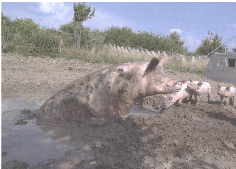
Genügend Auslauf und Beschäftigung: Freiland Schweine auf dem Biohof in Schüpfenried.

Hohe Standards beim Tierwohl sind aber auch für die Glaubwürdigkeit der Schweizer Landwirtschaft bei den Menschen zentral und bis heute sind sie ein wichtiges Argument für die einheimische Landwirtschaft. Wer nun auf diesem Weg stehen bleibt und sich mit dem Status Quo zufrieden gibt, unterschätzt die Chancen, die sich der Landwirtschaft eröffnen, wenn sie das Tierwohl achtet und aktiv an dessen Verbesserung mitarbeitet. Noch sind wir nicht am Ziel! ●