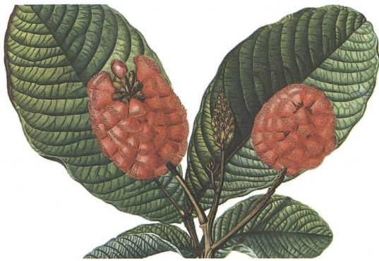
Die Dokumentation des Gesehenen geschah durch feine Zeichnungen oder Infografiken.

Alexanders Bruder Wilhelm von Humboldt. Dichtung und Wissenschaft trennte kein Graben, beiden ging es um Erkenntnis.