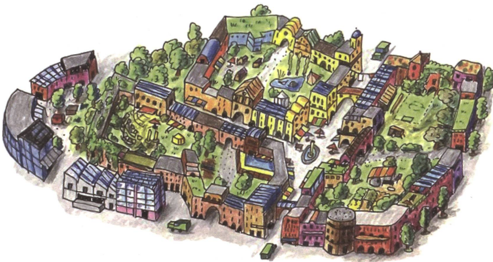
Modell dreier Neustart-Nachbarschaften, angedeutet durch die Blockrandbebauung, in einem Quartier.

Neustart Schweiz ist ein Verein besorgter BürgerInnen, der ein global verallgemeinerbares, möglichst leicht verständliches Modell erarbeitet hat, das auf die lokalen Gegebenheiten flexibel angewendet werden kann. Es ist der Versuch einer alternativen Lebens- und Wirtschaftsform, die unsere Städte und Agglomerationen verdichtet und den ländlichen Raum als Ort der Landwirtschaft, Energiegewinnung und biodiversen Natur stärkt. Nachbarschaften wirken so der ländlichen Zersiedlung entgegen, die drei Mal höhere Infrastrukturkosten aufweist als in der Stadt. 5 Vom Modell in die Praxis müssen die lokalen Gegebenheiten miteinbezogen werden.