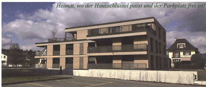
Heimat, wo der Hausschlüssel passt und der Parkplatz frei ist?

Entsteht auch so Heimat, wenn ein wenig Ewigkeit herübergrüsst? ●