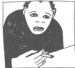
EINE ABSOLUT GRUNDLEGENDE FRAGE.