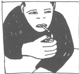
EIN WIRKLICH SCHWERWIEGENDES PROBLEM