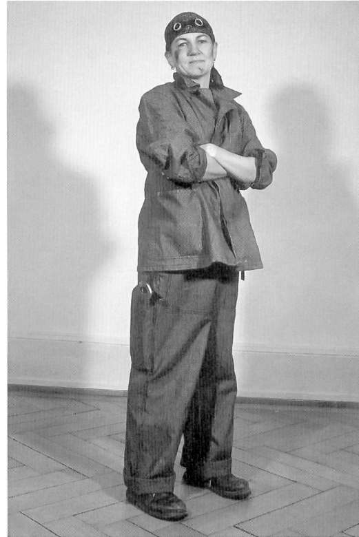
Öko-, Handwerks- oder Landlesbe

Du flirtest an einer Party mit einer attraktiven Unbekannten. Wie sieht sie aus?