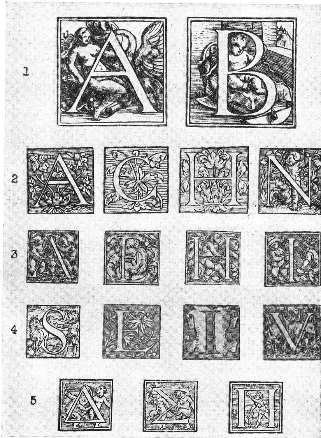
Abb. 3: Zierinitialen der Offizin Gessner, Zürich.