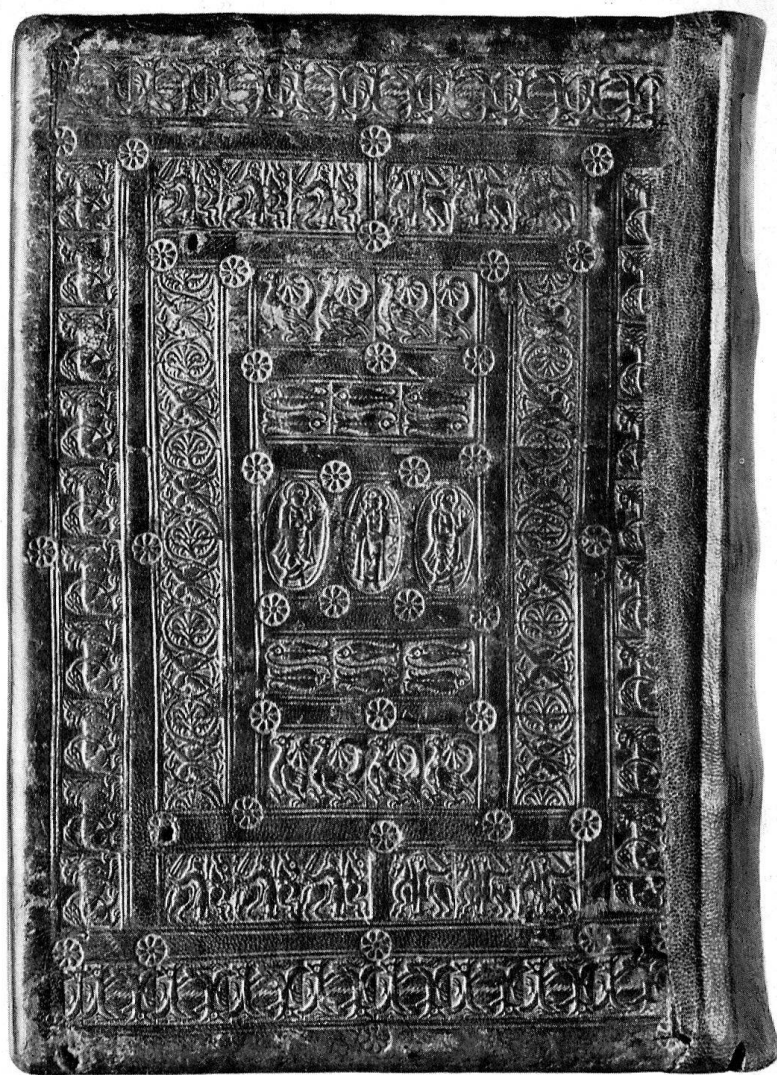
Rückseite des Buchdeckels Cod. 78 der Handschriftensammlung im Stift Engelberg