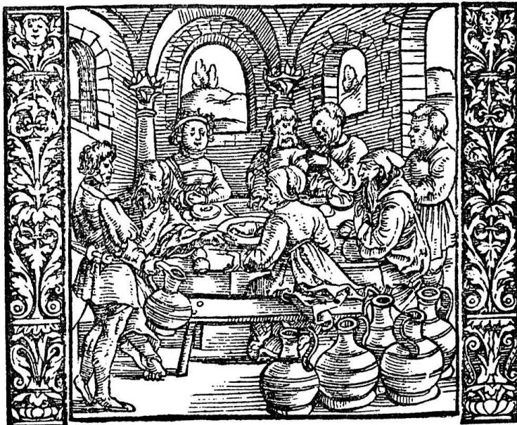
Die Hochzeit zu Kanaan. Von Hch. Vogtherr d. Ae. Aus der Zürcher Bibel von 1545

Ich freue mich, diese Bibeln in meiner Sammlung zu wissen, stellen sie doch ein einzigartiges Kulturgut dar; besonders die Zürcher Bibelverdeutschung bietet sprachlich manche Reize. Die früheste Textfassung ist ja bekanntlich der schweizerisch-alemannischen Mundart angeglichen, weil den Eidgenossen manche Ausdrücke der neuhochdeutschen Schriftsprache Luthers nicht verständlich waren. So setzten die Zürcher Prädikanten an Stelle des Lutherwortes «Wo nun das Salz thum wirt» den uns verständlicheren Ausdruck «Wo nun das Salz sin