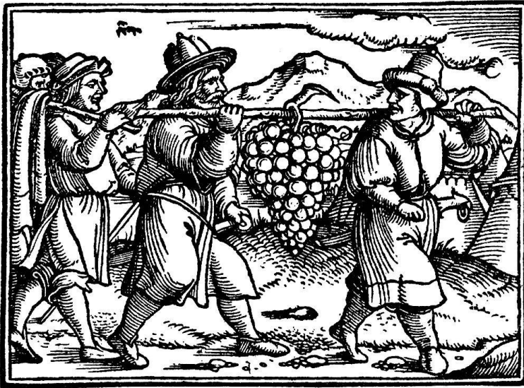
Die Kundschafter aus dem Lande Kanaan. Von Hans Holbein d. J. Aus der Zürcher Bibel von 1545