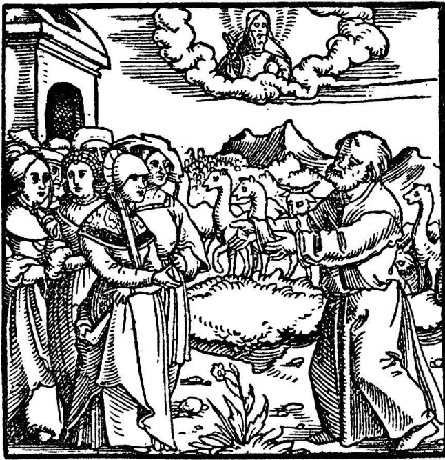
Hiob empfängt seine Verwandten. Hans Asper zugeschrieben. Aus der Zürcher Bibel von 1524/29