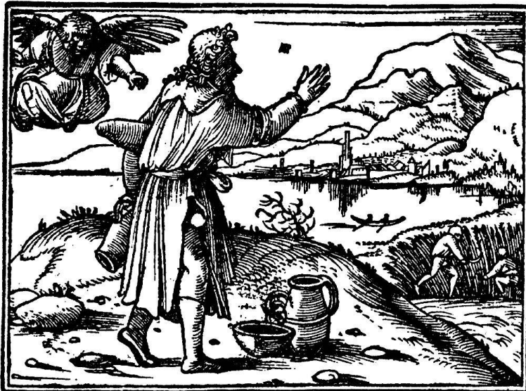
Habakuk bringt den Schnittern ihr Mahl. Von Hans Holbein d. J. Aus der Zürcher Bibel von 1545

Räbi verlürt». Oder für «Niemand flickt ein alt Kleyd mit einem Lappen von newem Tuch» die Fassung «Niemand büetzt ein alt Kleyd mit einem Bletz von neuem Tuch». Für Luthers Ausdruck «Aus einem Erdenkloß» setzten sie «UB Stoub von der Erden»; für «Sey on wandel» = «Biß uffrecht und redlich»; für «erträglich» = «lydlich»; für «Heuchler» = «Glychsner» usw. Hingegen ist die beharrlich herumgebotene, angeblich aus einer Zürcherbibel stammende Stelle «Du schmie-