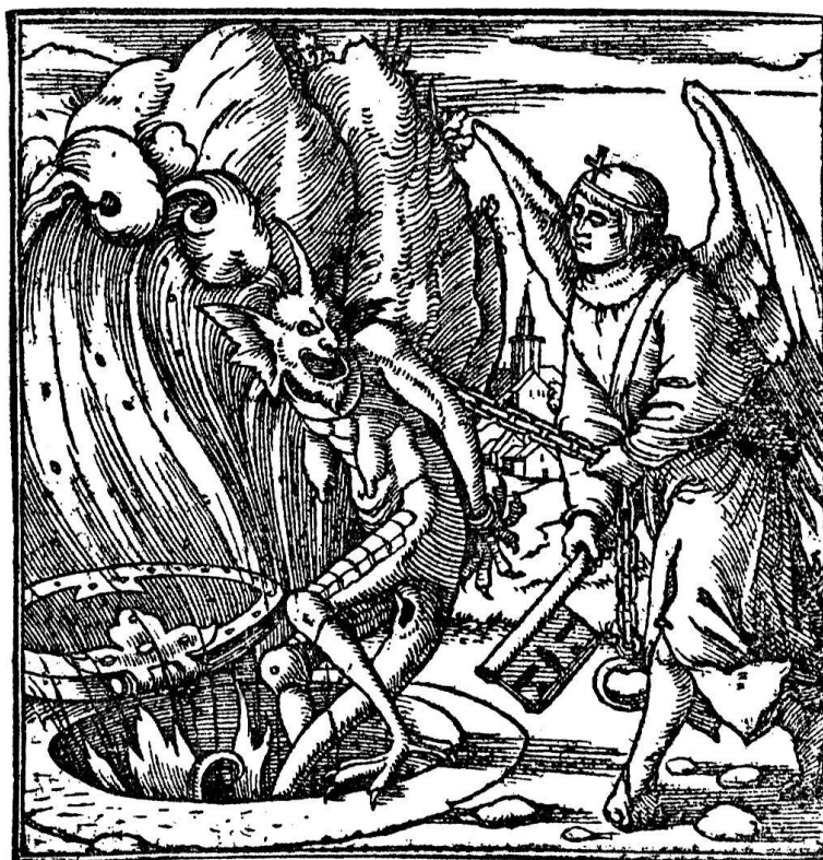
Der Engel verschließt den Satan in den Abgrund. Hans Holbein d. J. zugeschrieben. Aus der Zürcher Bibel von 1545