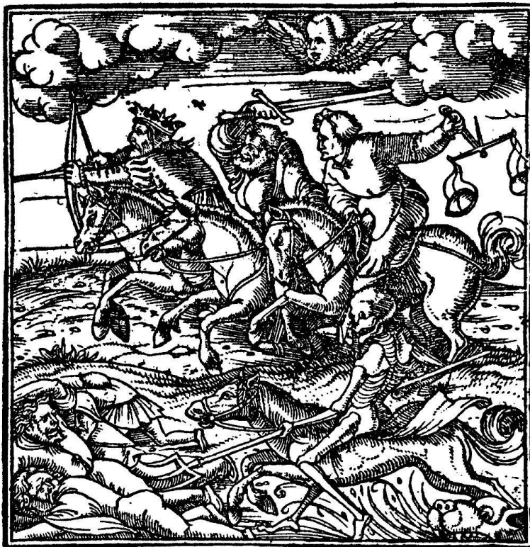
Abb. 7. Die apokalyptischen Reiter. Aus der Foliobibel. Zürich, Froschauer, 1536