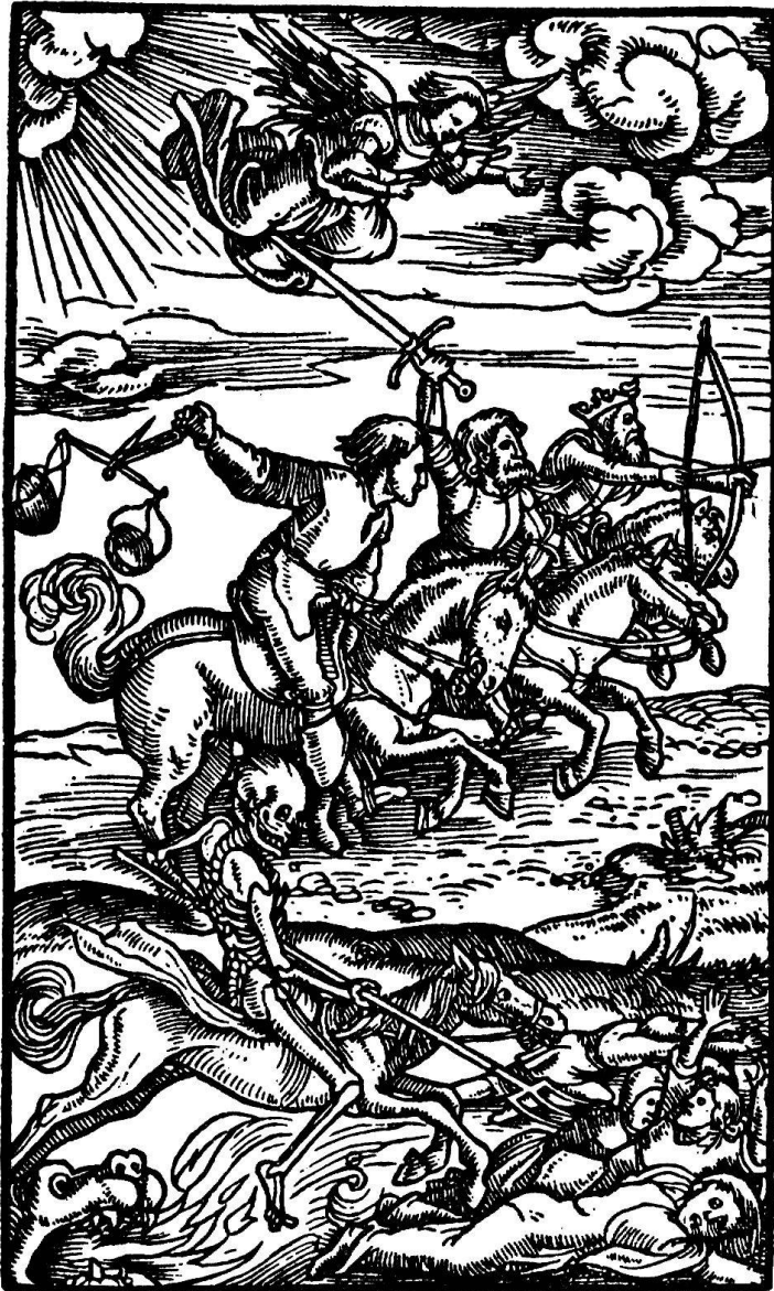
Abb. 6. Die apokalyptischen Reiter. Aus der Foliobibel. Zürich, Froschauer, 1531

klettern, in der sumpfigen Landschaft, der Aue, zur Darstellung bringen. Sie sind oftmals von vier Wahlsprüchen Froschauers umschlossen, welche auch ins Lateinische, Griechische und Hebräische übertragen vorkommen.