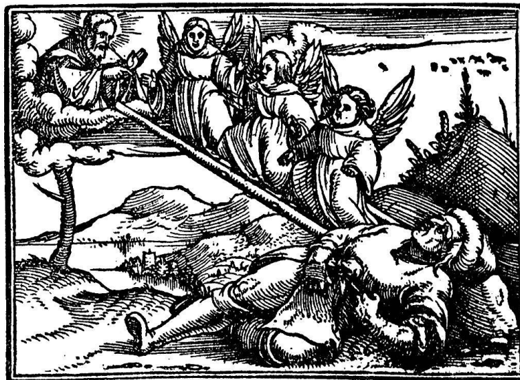
Abb. 5. Jakobs Traum von der Himmelsleiter. Aus der Foliobibel. Zürich, Froschauer, 1531

In dieser Epoche von Holbeins zweitem Basler Aufenthalt entstanden auch drei für die Zürcher Offizin entworfene Büchermarken, die alle, als Symbol Froschauers, einen Weidenbaum, um den sich Frösche tummeln und am Stamm empor-