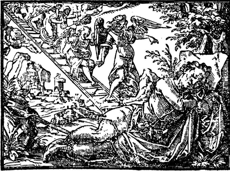
Abb. 9. Jakobs Traum von der Himmelsleiter. Aus der Foliobibel. Zürich, Wolf, 1596/97

zuweisen sind. Sie gelangten erstmals 1523 durch den Basler Drucker Thomas Wolf in Anwendung. Die für Froschauer bestimmten, seit 1536 und in der Folge vorkommenden quadratischen Holzschnitte (Abb. 7) waren offenbar nicht rechtzeitig fertig geworden, so daß er jene leihweise verwenden mußte.