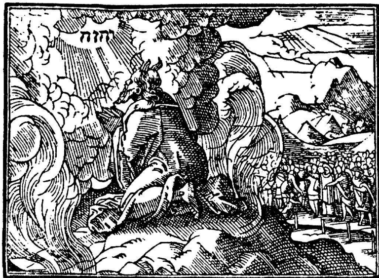
Abb. 10. Moses auf dem Berge Sinai. Aus der Foliobibel. Zürich, Wolf, 1596/97

rektor der Zürcher Foliobibel war. Die Foliobibel von 1545 ist diejenige, die in der Offizin Bodmer erschienene von 1638; sie sind beide in der Bibelsammlung vertreten.