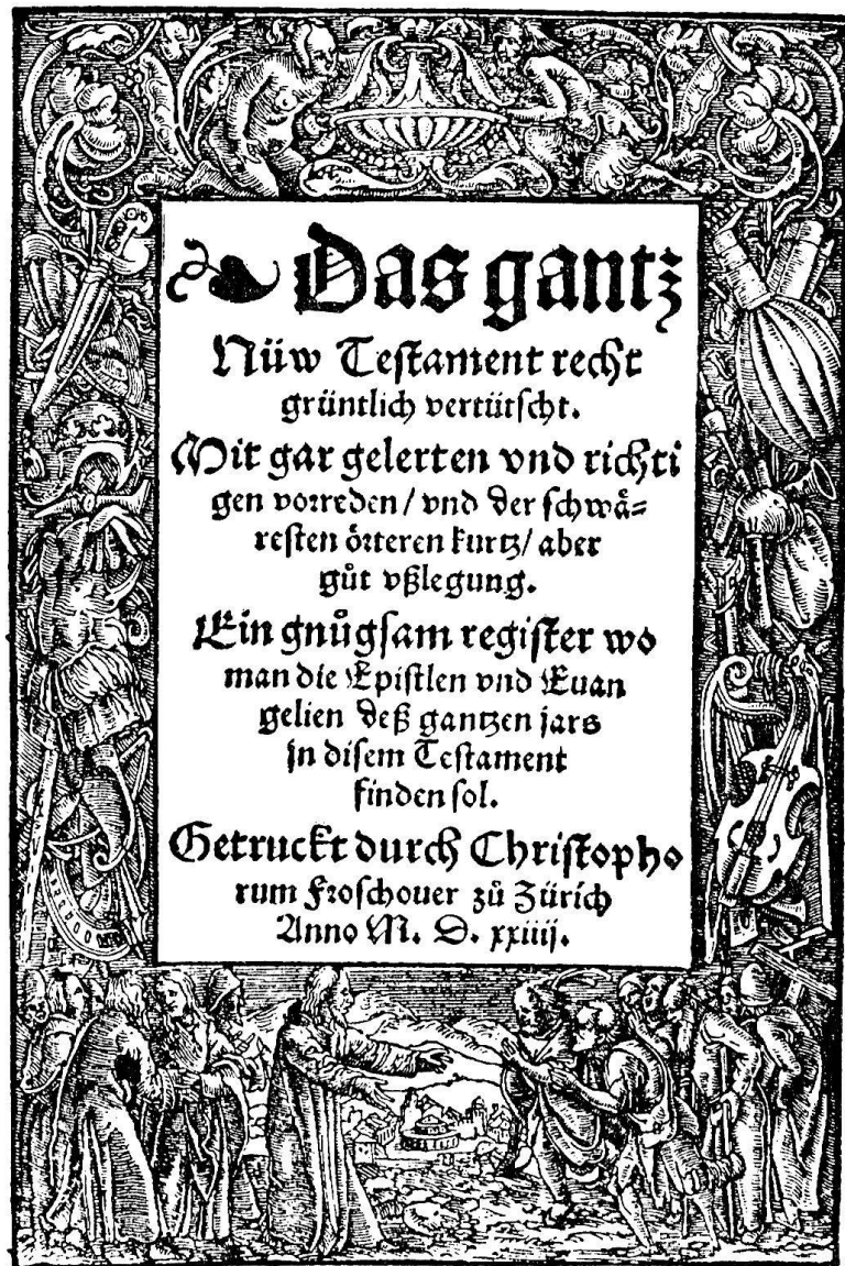
Abb. 2. Titelblatt zum Neuen Testament in-12. Zürich, Froschauer, 1524

Getruckt durch Christopho- rum Froschouer zu Zürich Anno M. D. xxiiij.