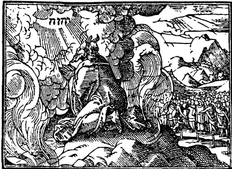
Abb. 10. Moses auf dem Berge Sinai. Aus der Foliobibel. Zürich, Wolf, 1596/97

Erwähnen wir noch, daß die Foliobibel von 1536 aus dem ehemaligen Besitz von Antistes Heinrich Bullinger stammt, was aus dem handschriftlichen Eigentumsvermerk «Ich bin Heinrich Bullingers» auf dem ersten Titelblatt hervorgeht; es handelt sich wohl um ein Geschenk Froschauers, bei dem Bullinger zeitweise als Kor-