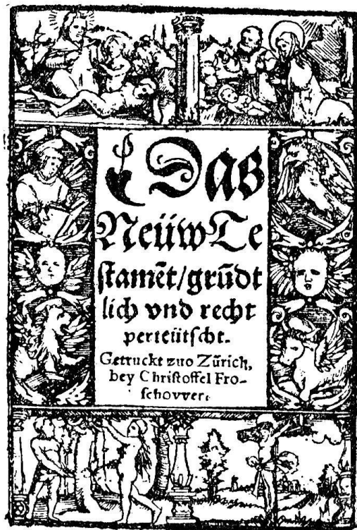
Abb. 1. Titelblatt zum Neuen Testament in-16. Zürich, Froschauer, 1527

Beinahe jede ältere öffentliche Bibliothek birgt wertvolle Bibelexemplare oder ganze Bibelsammlungen, wobei viele ihr besonderes Augenmerk auf die Bibeldrucke ihrer Landesgegend gerichtet haben und bestrebt sind, solche zu vervollständigen. Bibliotheken von Weltgeltung, wie die des British Museums in London, die Bodleian Library in Oxford, die Biblioteca Apostolica Vaticana in Rom, die Columbia University Library in New York, die Library of Congress in Washington, die Bibliothèque Nationale in Paris, die Preußische Staatsbibliothek in Berlin und die Bayrische Staatsbibliothek in München, enthalten sämtlich größere Bibelsammlungen mit berühmten Bibelmanuskripten oder Erstdrucken. Bei den beiden letztgenannten Bibliotheken wissen wir freilich noch nicht genau, wie stark die Bestände durch die Kriegsverwüstungen gelitten haben; die berühmte Bibelsammlung der Bayrischen Staatsbibliothek soll leider vollständig vernichtet sein!