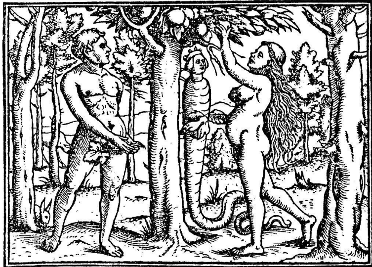
Abb. 4. Der Sündenfall. Aus der Foliobibel. Zürich, Froschauer, 1531

Zum Neuen Testament in-16 von 1530 (erstmal 1527) treffen wir einen Metallschnitttrahmen (Abb. 1), dessen Motive auf Holbein weisen. Er fand auch zum gleichformatigen Alten Testament Verwendung und zeigt deshalb, neben den Symbolen der vier Evangelisten sowie der