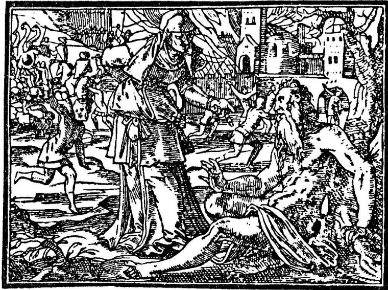
Abb. 11. Der aussätzigte Hiob von seiner Frau verspottet. Aus der Foliobibel. Zürich, Wolf, 1596/97

Über die Biblexemplare der Sammlung im Großmünster zu Zürich wäre noch manches zu berichten. Ich darf wohl verraten, daß die altehrwürdigen, zumeist in Kalbsleder gebundenen Bände mir besonders vertraut sind, habe ich doch Stück für Stück gereinigt, ausgebessert und fehlende Blätter durch photographische Faksimiles ersetzt, die Einbände geflickt oder wenn nötig durch den Buchbinder erneuern lassen, gekleistert, eingewachst und poliert, die Bücher mit dem Stempel der Kirchgemeinde versehen, sie numeriert und eingereiht. Aus meiner eigenen Sammlung steuerte ich einige fehlende seltene zürcherische Neue Testamente bei, und schließlich stellte ich