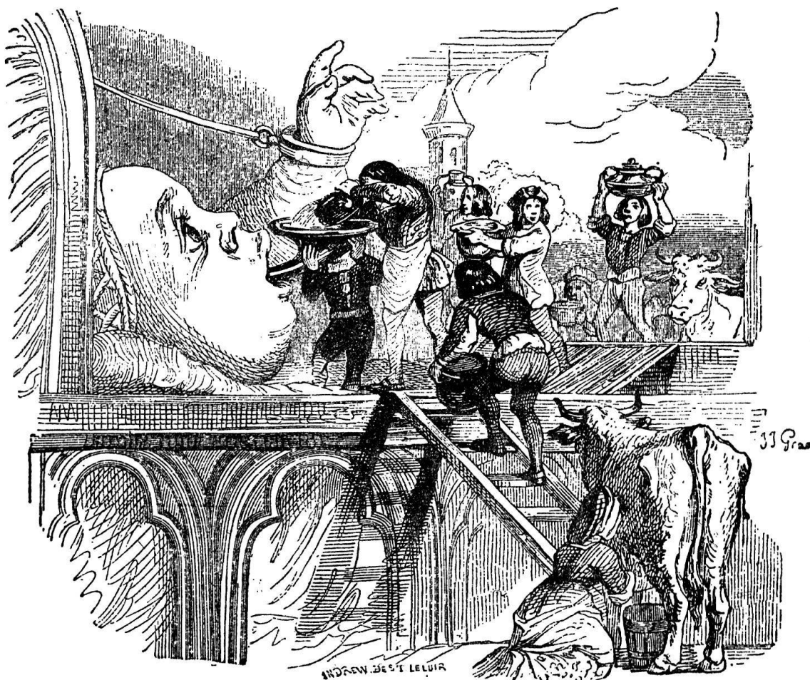
Gargantua dans son berceau. Une des illustrations pour les œuvres de Rabelais.

«Dans un doux songe qui la berce, elle aperçoit derrière un pâle nuage le croissant argenté (à son premier ou dernier quartier ou octant). Tout à coup le croissant se transforme en la simple forme d'un humble cryptogame ... puis d'une plante ombellifère ... à laquelle succède une ombrelle, qui va se transformer en une orfraie ou chauve-souris aux ailes et dentelées. Notre rêveuse ne mêle-t-elle pas ensemble ses achats du marché