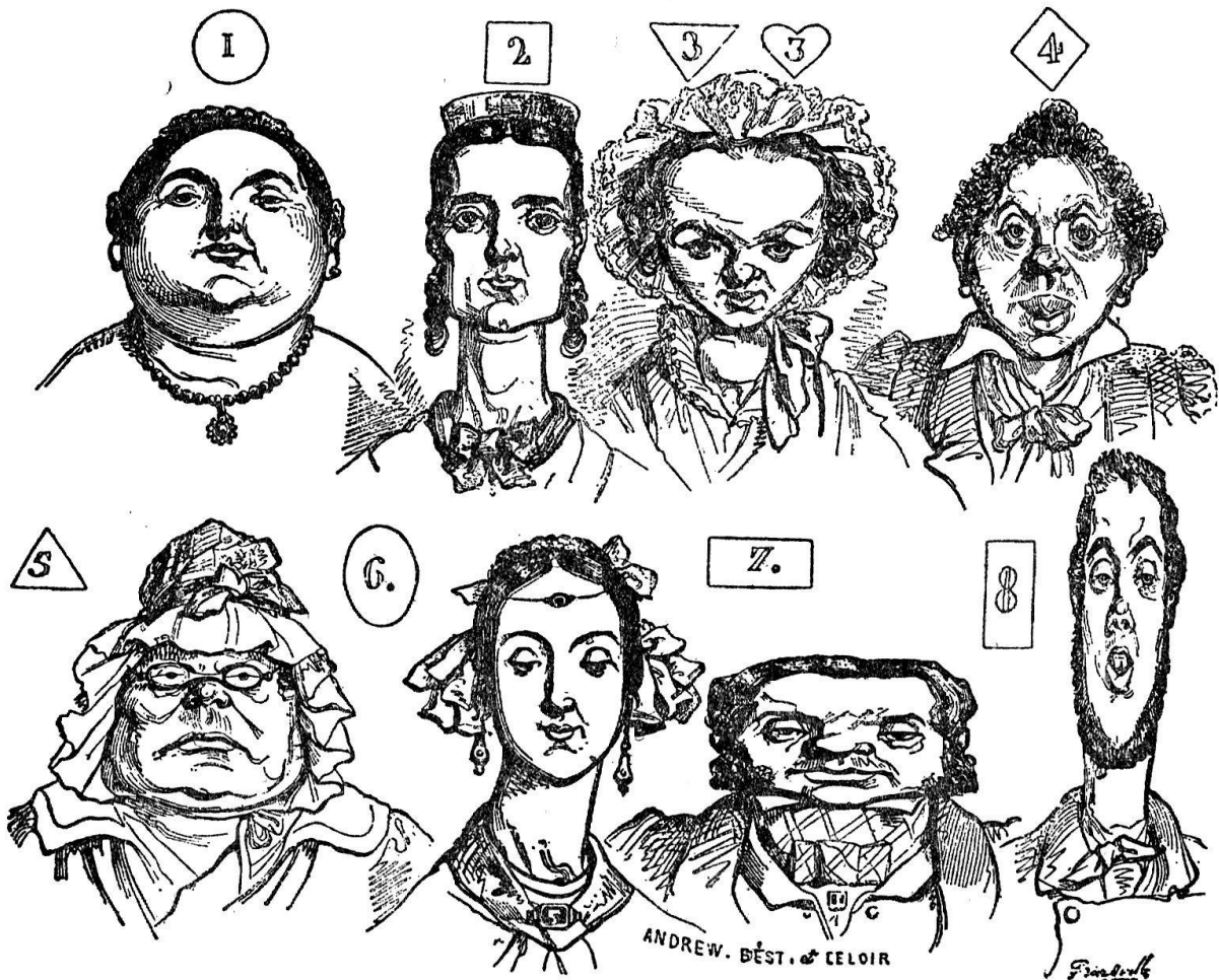
Différentes formes du visage.

avec les souvenirs d'une promenade en plein champ, où elle aura rencontré le vénérable champignon et cet arbuste en forme de parasol; avec les souvenirs de l'astre argenté qu'elle a contemplé le soir d'une belle journée d'été, tandis qu'elle voyait voltiger devant elle une chauve-souris; ou bien encore avec l'ombrelle qui lui avait servi à se garantir des feux du soleil couchant, et qu'elle agita pour chasser l'oiseau nocturne? A mon avis, on ne rêve aucun objet dont l'on n'ait eu la vue ou la pensée lorsque l'on était éveillé, et c'est l'amalgame de ces objets divers entrevus ou pensés, à des distances de temps souvent considérables, qui forme ces ensembles si étranges, si hétéroclites des songes, au gré d'ailleurs de l'activité plus ou moins grande de la circulation du sang.