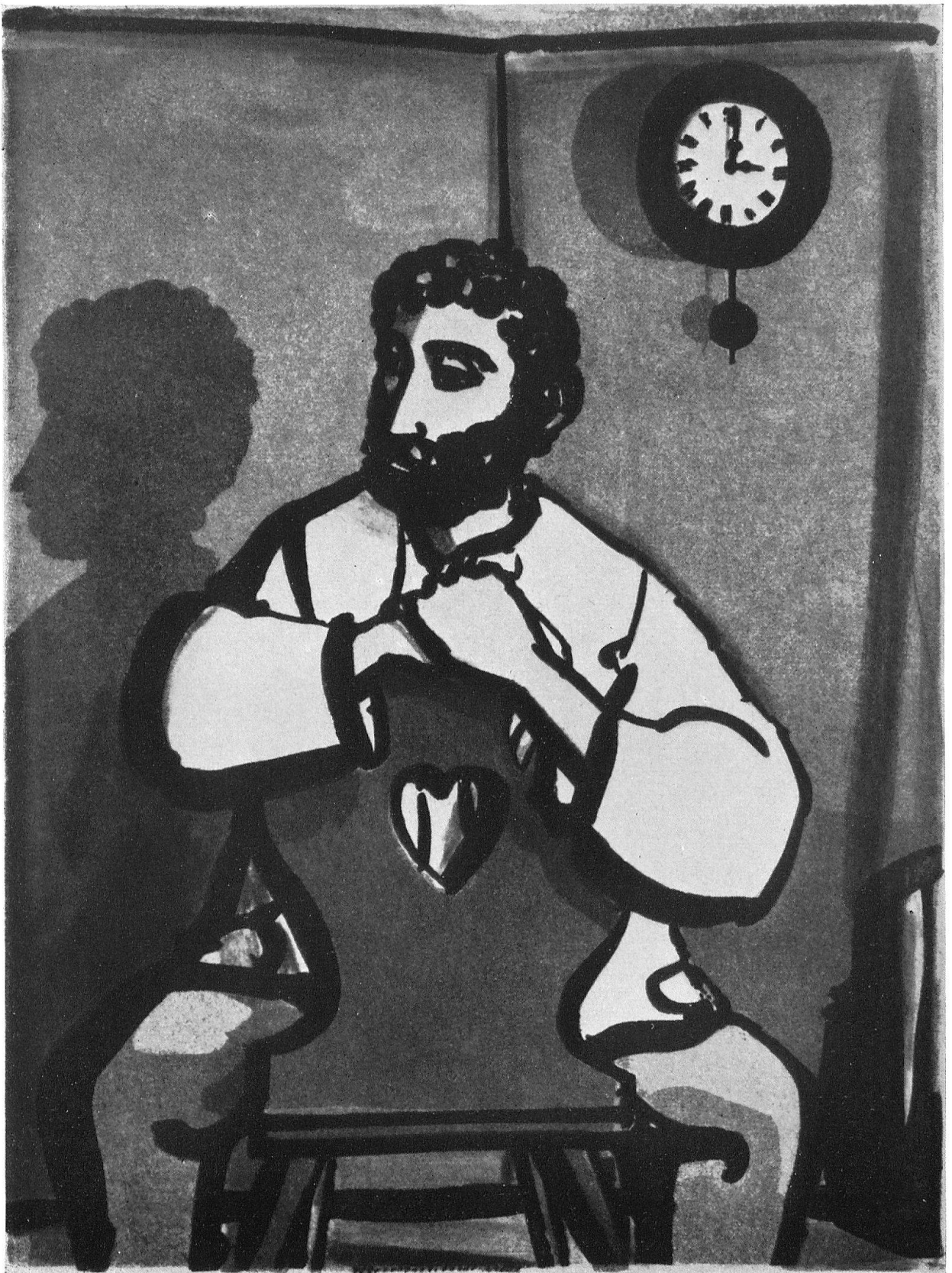
Max Hunziker: Jenseits der Zeit. Farbige Aquatinta zu «Terre du Ciel» von Ramuz