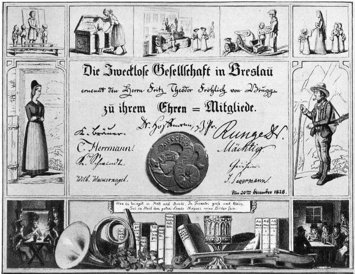
Mittelfeld (17,6/13,2) aus dem auf der Oeffentlichen Bibliothek der Universität Basel aufbewahrten Diplom der Zwecklosen Gesellschaft in Breslau, datiert: den 20. December 1828

Nur noch kurz ein Wort über das Lied, auf welches man diese Titelradierung beziehen könnte: Heft 1, Nr. 5: «Arnold von Winkelried» («Wo Schweizerfahnen wallen in das Feld ...»). Es wäre meiner Ansicht nach verfehlt, zu sagen, Disteli habe seine Illustration speziell zu diesem