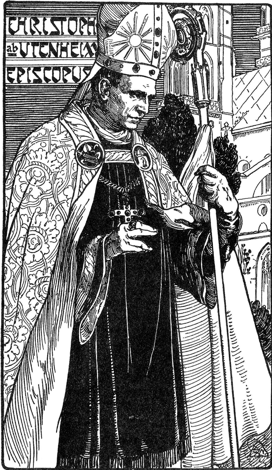
Bild aus dem «Offiziellen Festbericht der Basler Bundesfeier 1901»