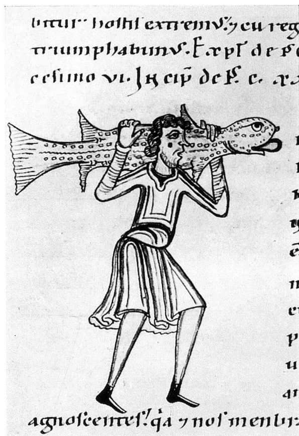
Abb. 2. Buchstabe T aus einer Frowinhandschrift: Ein Mann, einen Fisch tragend

stellten Bande birgt unsere Bibliothek aus der gleichen Zeit auch andere Schriften von ihm. Und Bernhard ist nicht der einzige zeitgenössische Schriftsteller, der in Engelberg Aufnahme gefunden hat. Auch Hugo und Richard und Achard von St. Viktor sind hier bekannt, man hat Anselm von Canterbury gelesen und abgeschrieben, und man hat auch schon Stellung genommen zu Petrus Abaelard, der zu Paris die Gemüter in Aufregung brachte. Kurz: wir finden im 1120 entstandenen Kloster von Engelberg ein geistiges Leben, das auf der Höhe der damals modernen theologischen Autoren ist, das lebhaften Anteil nimmt an der Blütezeit, die eben in Frankreich, erst in Burgund und dann in Paris, aufgebrochen ist.