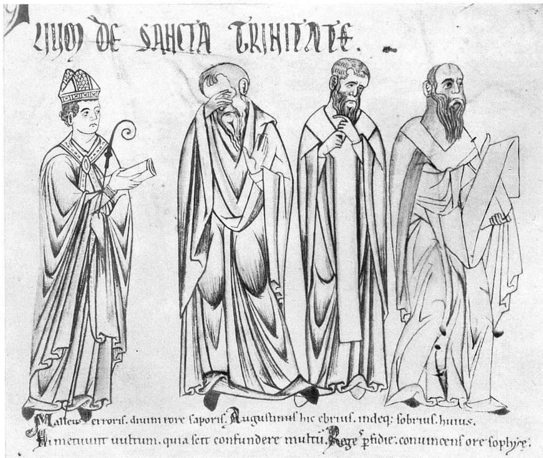
Abb. 7. Augustinus und die drei Häretiker. Aus Cod. 14. Vom Engelbergermeister gezeichnet