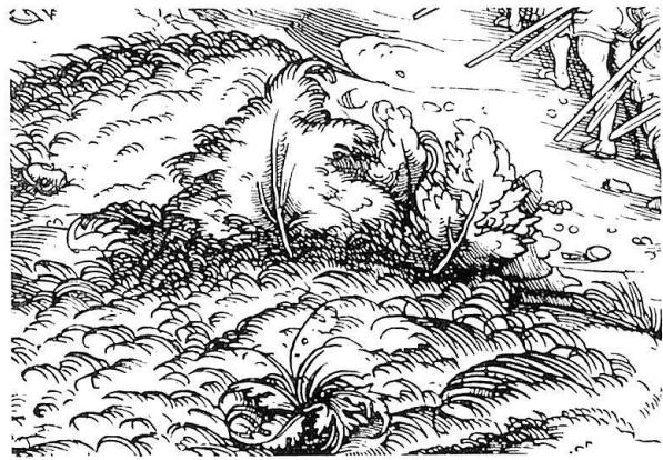
Abb. 5. Detail eines Weißkunigholz-schnitts (Wiener Faksimile-Ausgabe S. 233)

Als Vergleich zu Simon mit der Kappe (Abb. 10) sei ein Ausschnitt aus dem Ciceroholz-schnitt des Petrarcameisters «Einer siebt Menschen- und Tierköpfe» (M. 489) gezeigt (Abb. 11). Laubbehandlung und Faltung des Kopftuches stehen sich außerordentlich nahe. Weitere Ähnlichkeiten ergeben sich beim Vergleich von Nase und Bart mit dem Trostspiegelholz-schnitt «Einem mit Szepter wird ein Buch präsentiert» (M. 105); die geteilten langen, in einzelnen Strähnen herabwallenden Bärte und der nach unten hängende Schnurrbart sind vielfach beim Petrarcameister zu finden, so etwa an einer Gestalt im Hintergrund des Trostspiegelholz-schnitts zum Kapitel «Von Freundschaft» (M. 112) oder beim verspotteten Greis (M. 156); die Laubbehandlung mag man mit dem Laub der Trostspiegelillustration «Entführung einer Frau in einen Wald» (M. 207) vergleichen, wie denn die Laubwiedergabe beim Apostel Bartholomäus mit einem Detail aus dem in meinen eingangs erwähnten Ausführungen gezeigten Ciceroholz-schnitt «Der Wanderer auf hohem Steg» (M. 495) zusammengeht. Die Wolkenbildung der Zeichnungen etwa im Hintergrund der Bartholo-