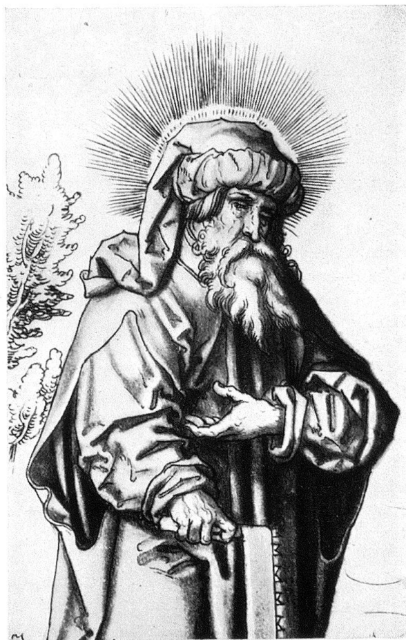
Abb. 10. Detail aus Abb. 6

Beim Vergleich der Apostelzeichnungen mit den Holzschnitten des Petrarcomeisters sind auch die Grasnarben zu Füßen der Apostel mit ihren starken, sich seitlich zu Boden biegenden Halmen zu beachten. Als Büschel mit nach beiden Seiten ausbiegenden Halmen erscheinen sie im Holzschnitt der Kindheit Christi (M. 362) oder im Ulysses an der Spitze des Heeres (M. 547), wie sie ebenso im Weißkunigholzchnitt, dessen Detail gezeigt wurde (Abb. 5), vorkommen. Als letzte Einzelheit möchte ich auf die Behandlung von Baumstämmchen in den Apostelblättern und beim Petrarcomeister hinweisen. Das Baumstämmchen des Johannesblattes sehe man zusam-