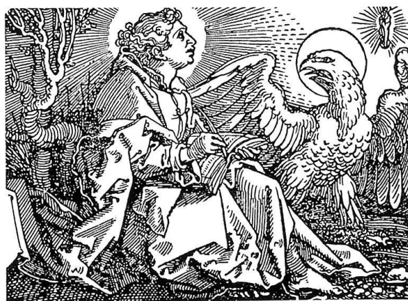
Abb. 2. Holzschritt aus Novi Testamenti Icones , Fft-M. 1551 (H. S. Beham, P. 355)

Andere Schritze des gleichen Buches, darunter vier Evangelistendarstellungen sollen Hans Sebald Beham angehören, der für Egenolph seit 1532 tätig war. Mir will es scheinen, als liege hier eine Verwechslung vor. Ich zeige als Beispiel Johannes auf Pathmos (Pauli 355), eine Komposition, die entweder unter Benutzung eines Holzschrittes zu Luthers Übersetzung des Neuen Testaments, Wittenberg, Hans Luft 1535 (Schramm, Luther und die Bibel Abb. 375) entstand oder, was wahrscheinlicher ist, als Anregung für jenen Holzschritt diente (Abb. 2). Schon die