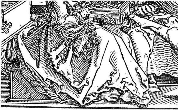
Abb. 3. Petrarcameister, Detail des Holzschnitts M. 139

schnitte Hans Brosamers, nämlich nicht nur unsignierte, sondern auch solche, die H.B. monogrammiert sind, heute noch als Beham angesprochen werden, mag es zur richtigen Bestimmung derselben von Nutzen sein, die redenden Signaturen jenes Brosamer mit heranzuziehen.