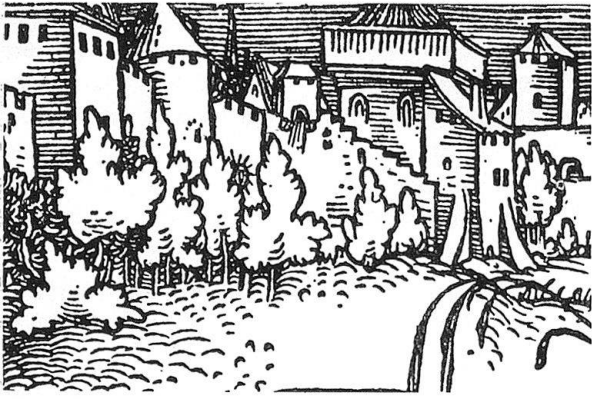
Abb. 13. Petrarcomeister, Detail des Holzschnitts M. 215 aus Petrarcas Trostspiegel, 1532

stellt» (M. 275) vergleichen kann. Die angedeuteten Palmenwipfel, die Palmettenbäumchen mit den gleichsam «festonierten» Umrißlinien, die Gewanddrapierung mit dem langen, am Boden schleifenden Mantelende, das alles spricht die Formensprache des Petrarcomeisters. Die Art der Aufteilung des Baumstumpfes mit dem in der aufgeplatzten Rinde erscheinenden Dreieck des Stammholzes (vgl. hierzu Brosamers Johannesholzschnitt, Gutenberg-Jahrbuch 1953, S. 85, Abb. 11), die senkrecht geführte Rundbogenlinie am rechten Stammrand, die Wurzeln, die in zwei Spitzen auslaufen sind ähnlich im Baumstumpf der Bartholomäusdarstellung zu verfolgen.