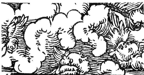
Abb. 1. Petrarcomeister, Detail des Holzschritts M. 371