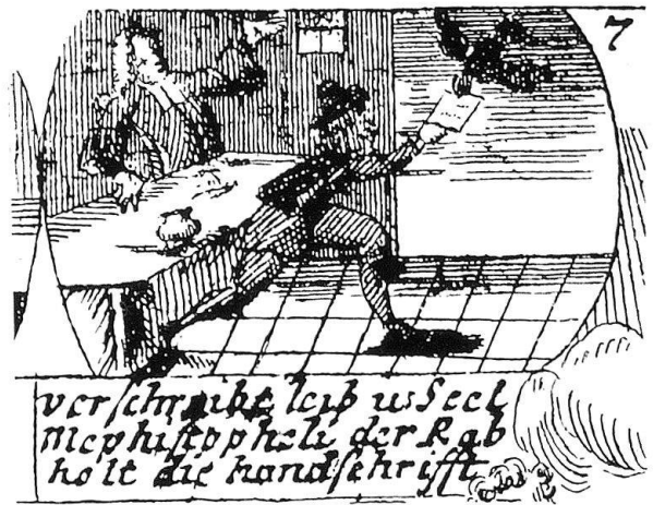
Ein Raabe kömmt aus der Luft und hohlet die Handschrift des D. Fauste.

Dem Bildchen Nr. 5 wird man eine innere dramatische Spannung nicht absprechen können. Daß Faust den Mephistopheles als einzigen unter den beschworenen Geistern zum Diener nimmt, da er so «geschwind als der Mensch gedancke»,