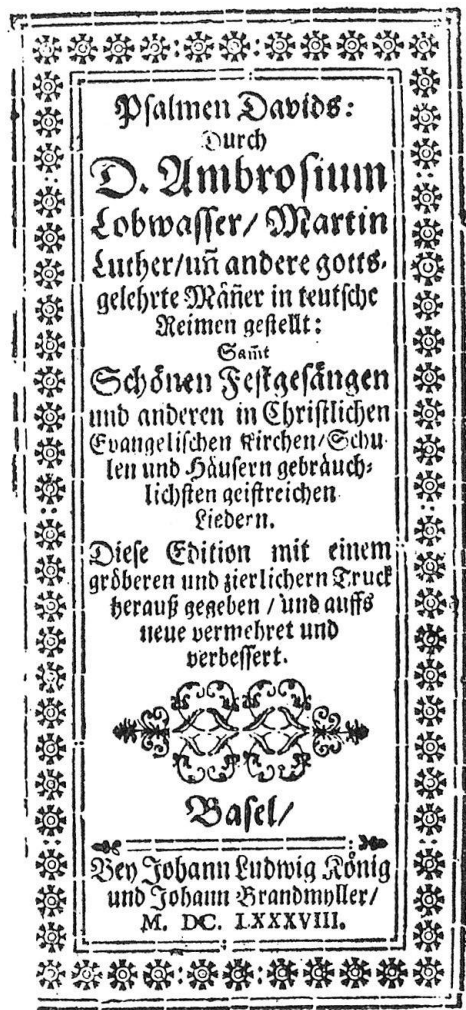
Abb. 3. Titelblatt des reichsten Basler Gesangbuches aus dem 17. Jh. (1688), nach dem einzigen erhaltenen Exemplar (vgl. Anm. 23). Das schmale, hohe Format ist ein Kennzeichen der Basler Gesangbücher bis ins 18. Jh. hinein (vgl. Abb. 4).

Das ist noch heute im Basler Gemeindegesang deutlich spürbar und hatte in der Gesangbuchgeschichte die Auswirkung, daß – von Ausnahmen abgesehen – Basel erst ein vierstimmiges Gesangbuch erhielt, als es sich für das vor nunmehr genau 100 Jahren erschienene Kantonalgesangbuch mit der Landschaft zusammentat 30 .