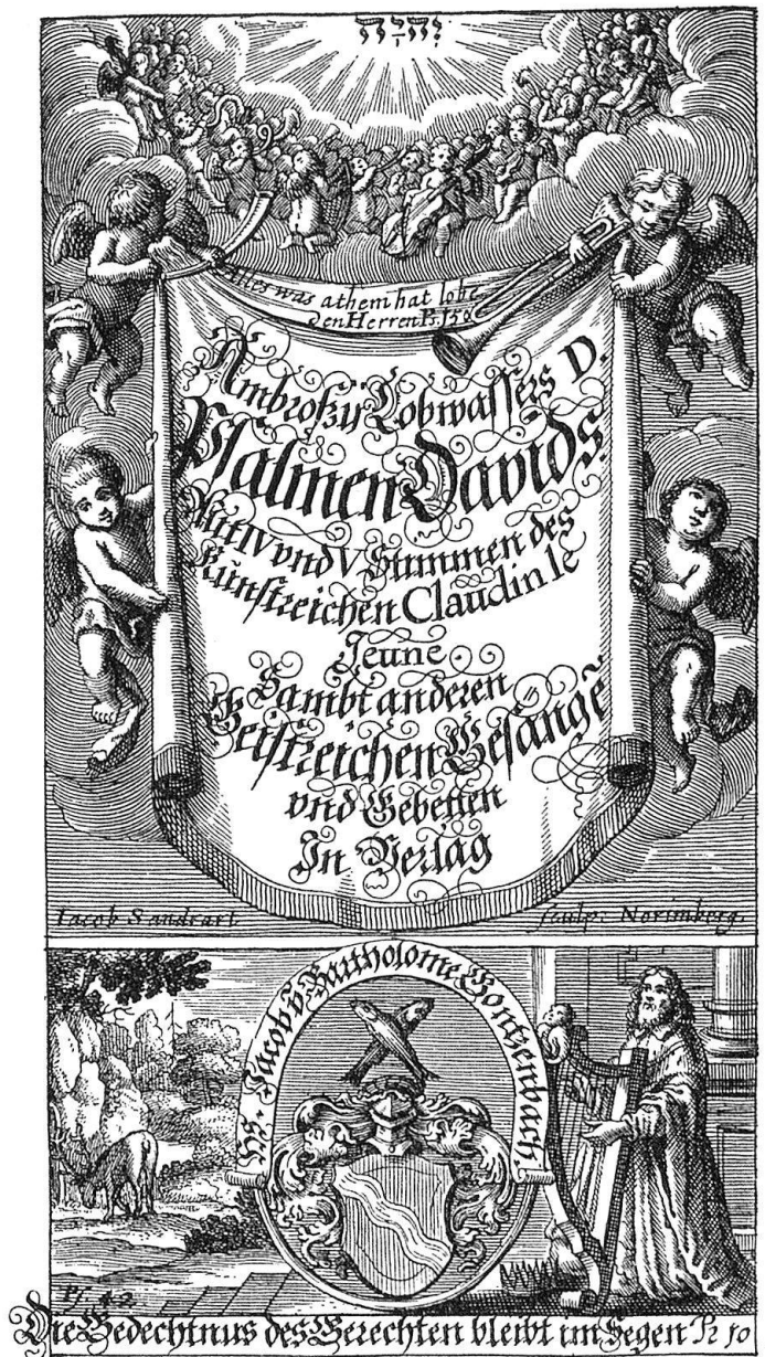
Abb. 5. Kupfertitel und Titelpuffer des musikalisch bedeutsamsten Basler Gesangbuchdruckes mit den Psalmsätzen von Claude Le Jeune (um 1530–1600) und Liedsätzen wahrscheinlich vom Basler Johann Jacob Wolleb (1613 bis 1667), gedruckt 1659 bei Joh. Jac. Genaths sel. Wittib auf Veranlassung der St. Galler Leinwandfabrikanten Joh. Jac. und Barth. Gonzenbach.

bis heute noch nicht gedeutet worden ist 38 . Von der Bedeutung dieses Gonzenbachschen Gesangbuches für die ladinisch sprechenden Gemeinden zeugt aber vor allem der Nachdruck der Le Jeune-Sätze (mit den romanischen Psalmtexten Lurainz Wietzels von 1661), der 1733 in Strada, der un-