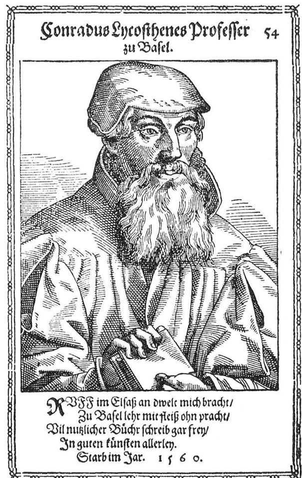
Abb. 2. Der erste Basler Hymnologe Conrad Wolffhart von Ruffach. Seitenverkehrte, aber gute Holzschnittkopie nach einem Stich von René Boyvin, aus Nicolaus Reusner, Icones sive imagines virorum literis illustrium, ... Argentorati 1590 . Das Todesjahr Wolffharts ist nicht 1560, sondern 1561 (vgl. Anm. 21).

das nicht im ersten Teil die Lobwasser-Psalmen enthalten hätte. Aber der zweite Teil behielt sein starkes Eigengewicht und umfaßte nicht selten doppelt bis dreimal so viele Lieder wie der Lobwasser-Teil. Es wurden hier nicht nur alle wichtigen der im 16. Jahrhundert in den Schweizer Gesangbüchern überlieferten Textweitergepflegt (darunter viele, die sich um diese Zeit sonst nirgends mehr finden), sondern auch die wenigen trotz der Alleinherrschaft des Lobwasser auf dem reformierten Boden Deutschlands entstandenen Lieder und daneben eine ganze Reihe von nachweislich oder vermutlich in Basel entstandenen Stücken geboten (vgl. z. B. Abb. 4). Das reichste dieser Gesangbücher ist das von 1688, gedruckt bei